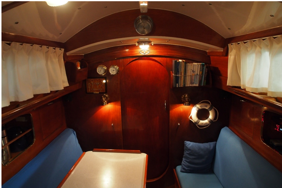
Foto zusterschip BN 410